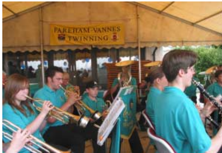
Animation assurée par le bel orchestre de Fareham.