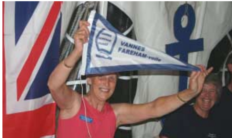
La remise du pavillon, quelle fête !