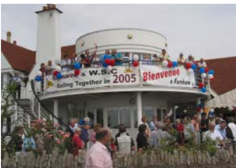
Au club de Warshah accueil chaleureux des français