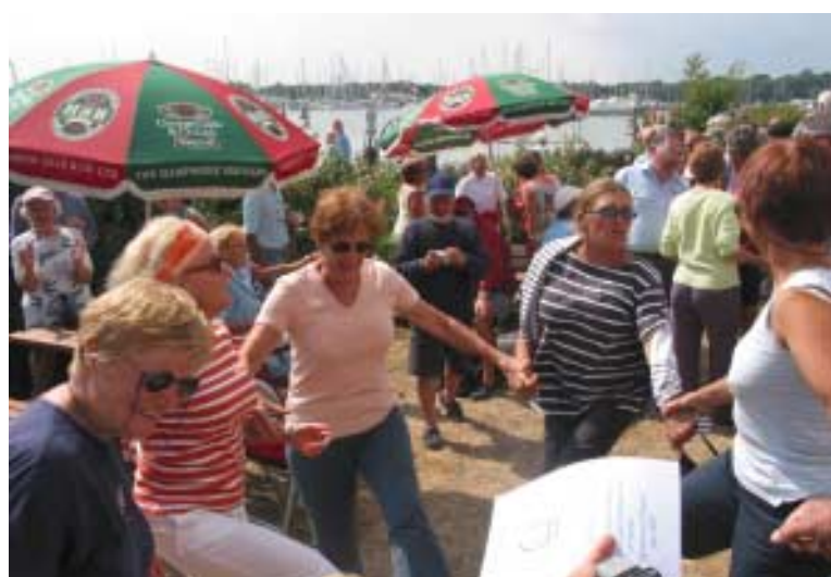
elles dancent la ridée