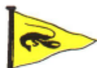
Warsash Sailing Club