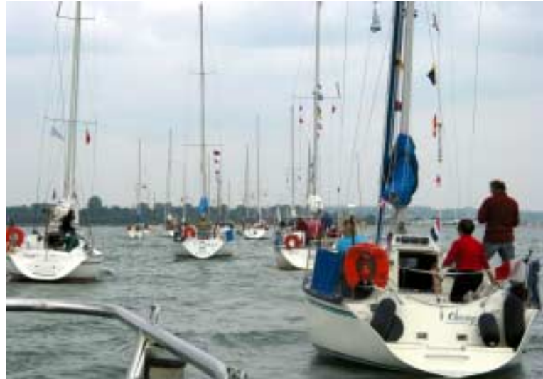
à la queue leu leu, régal du photographe