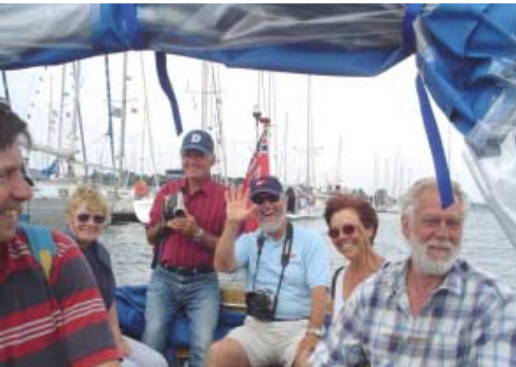
à bord du canot, heureux de retrouver la terre ferme et les amis anglais