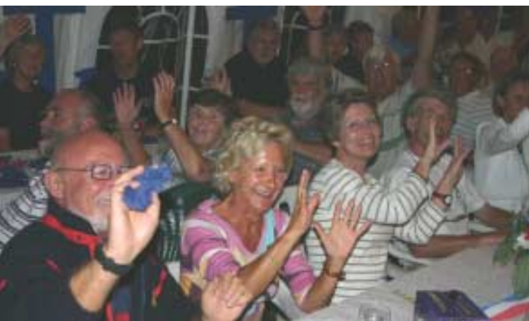
Beaucoup de gaité, même à la table des responsables