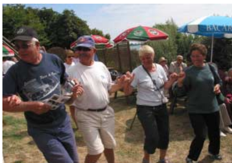
quelle ambiance !