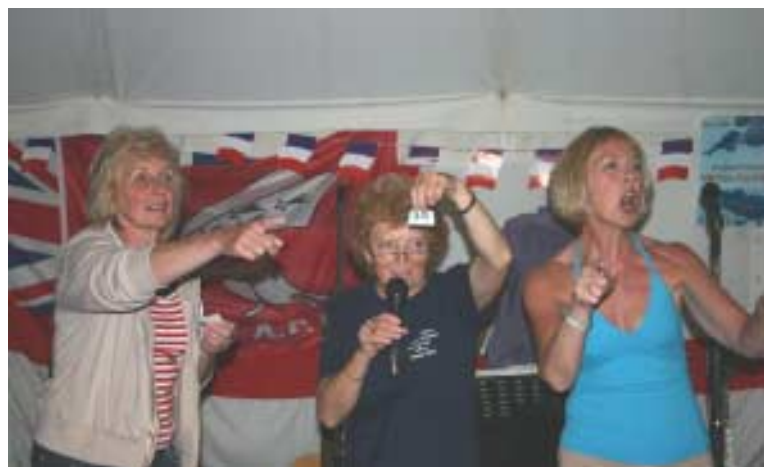
Au jeu de la loterie, à qui le lot ?