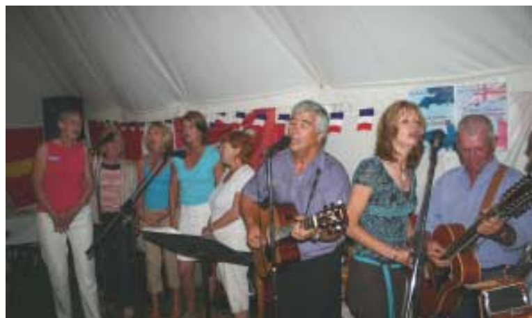
Le chœur des petites anglaises accompagné des musiciens de la soirée