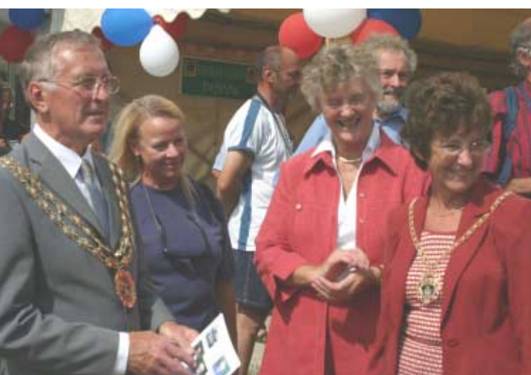
Monsieur le maire de Fareham, son épouse et les responsables du jumelage