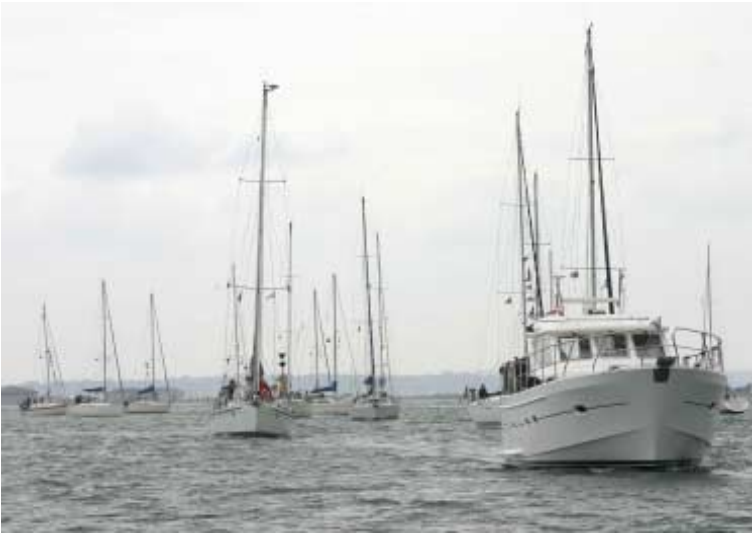
la flottille dans le Solent en route vers le point de ralliement...