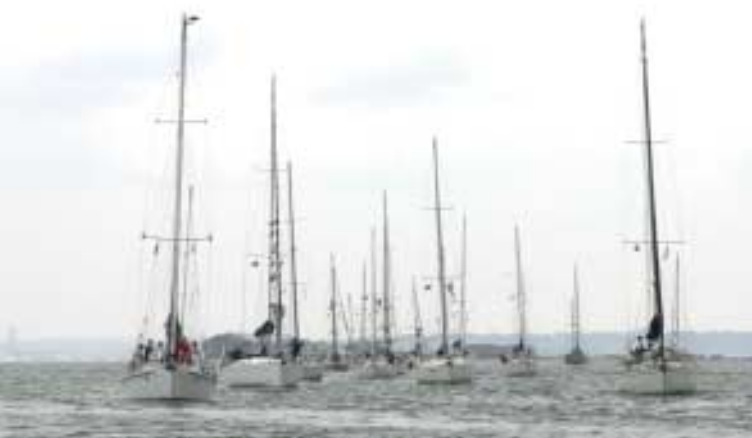
arrivée groupée à Warsash