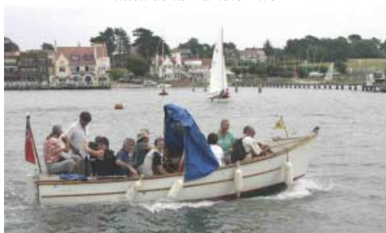
Le canot des permissionnaires