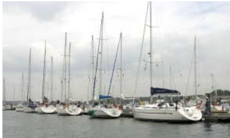
Une grande partie de la flotte amarrée au ponton au milieu de la Hamble River